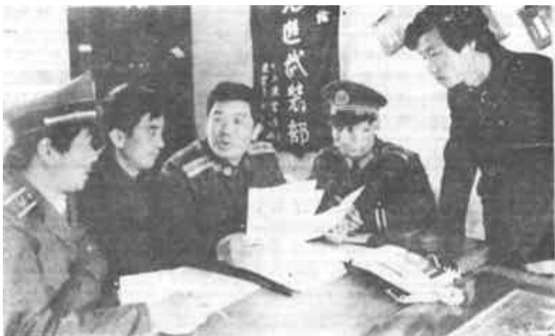
为保证新兵质量，向部队输送合格兵员，东营区辛店镇征兵领导小组认真做好新兵的政审工作，坚持原则，择优定兵。图为镇政审班子、派出所认真审查新兵材料。