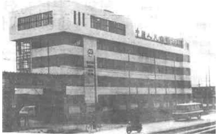
市保险公司自成立以来服务范围迅速扩大。目前，一座建筑面积8000平方米的办公楼已投入使用。图为大楼外景。

目前，棉花春播即将进行，除做好深耕深翻、精细整地、施足底肥、造墒保墒等准备外，还应做好棉花的种子处理和适时播种。